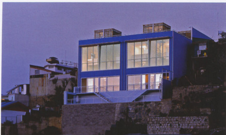
Na fasáde obrátenej do svahu, oživenej vtípnym náznakom mierneho sklopenia, dominujú veľkoplošné okná. Terasa je spoločná pre dva byty.

rok na kopci Yungay vo Valparaíse. Je to jeden z mnohých strmých kopcov, na ktorých je postavené historické centrum stredočílského veľkomesta, nepatrí však do oblasti nedávno vyhlásenej za miesto svetového kultúrneho dedičstva UNESCO. Mladí architekti z Inmobiliaria Rearquitectura Ltda zrekonštruovali opustenú rozvalinu s rešpektovaním pôvodných prvkov, hmoty, fasády i jej zvyčajnej lokálnej farebnosti, hoci nová je z vlnitého kovového