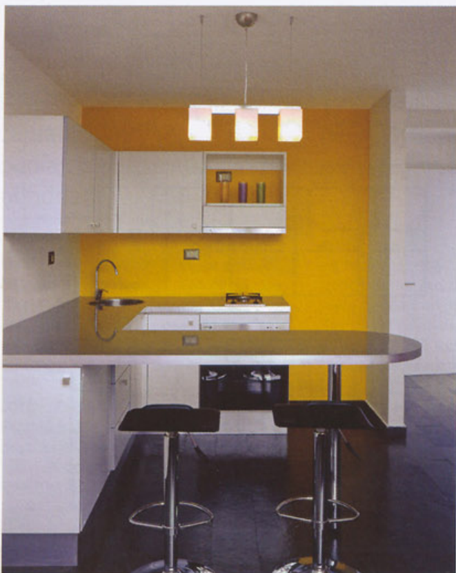
V kuchyni dominujú kovové povrchy.

Dnes, keď sa toto bývanie vďaka Thatcherovej zákonu z roku 1987 (Town and Country Planning Use Classes Order) rozšírilo od polovice 80. rokov z USA cez Londýn, Frankfurt a Rotterdam do celého sveta, majú lofts aj rôzne hybridné formy. Vyni-